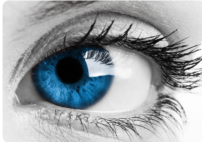
Abbildung eines gesunden Auges

Bestandteile eines intakten Tränenfilms sind neben Fetten, Mucin und dem wässrigen Teil besonders auch Mineralien und Salze, mit denen die Hornhaut Ihres Auges versorgt wird.